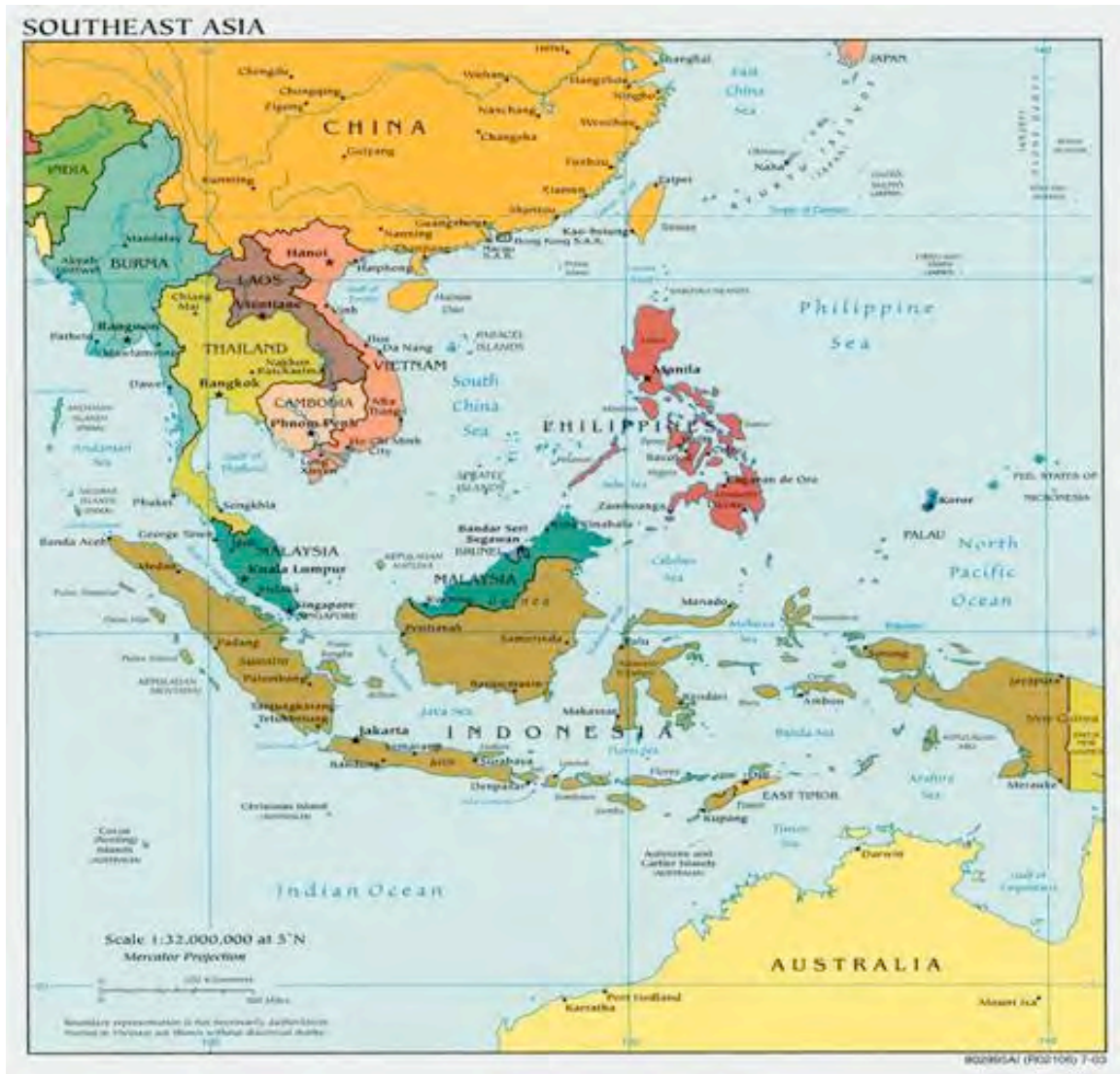
Peta di Asia Tenggara.

Ada banyak variasi di silat. Banyak seni bela diri lain asalnya yang silat tuo, seni bela diri negeri Pilipina tradisional asalnya silat. Kepulauan Melayu punya banyak variasi silat, seperti Silat Seni Gayong . Ada banyak variasi silat dari Jawa juga. Pencak