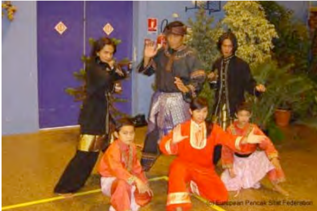
Kejuaraan Perancis, Februari 2004 (European Pencak Silat Federation)

Antarabangsa (PERSILAT) pengurus pencak silat di tingkat internasional, organisasinya di Jakarta, Indonesia, dan organisasi ini melindungi organisasi silat lain. Silat populer di Amerika juga, ada kelompok silat yang melatih orang-orang di negara bagian yang lain, dari California sampai ke Connecticut.