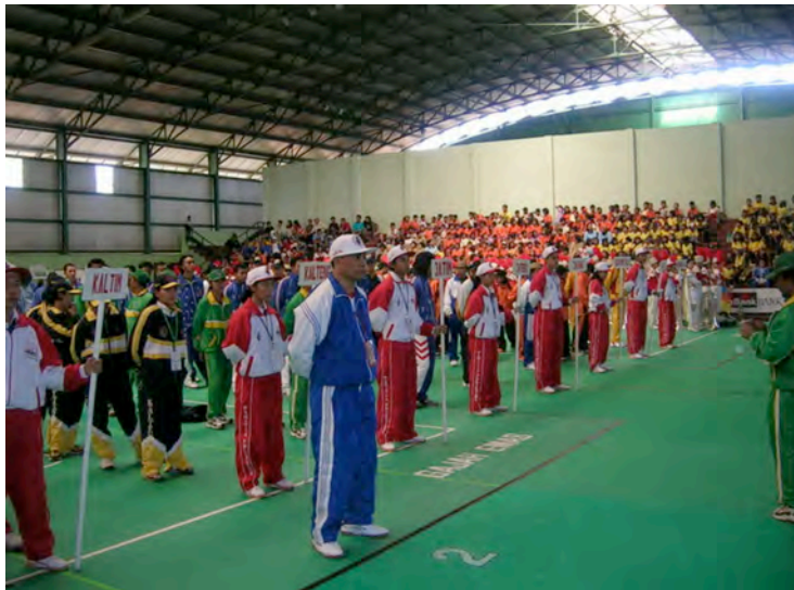
Pembukaan PON XVI 2004 di Palembang, Indonesia

Ada Pekan Olahraga Nasional (PON) setiap empat tahun dan di sana silat ada juga, tapi ada orang-orang yang tidak mau silat dipakai sebagai persaingan olahraga , seperti Persatuan Pencak Silat Indonesia (PPSI).