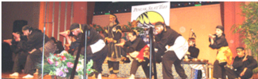
Acaranya "Secrets of the Heart II" di Rackham di 2004.