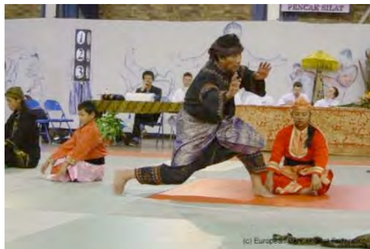
Kejuaraan Pencak Silat Eropa, November 2004