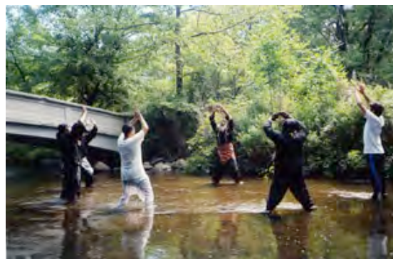
Latihan di sungai di Ann Arbor.